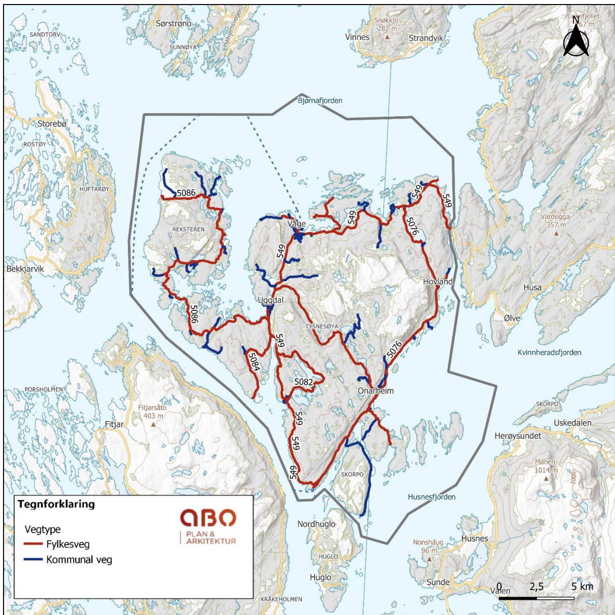
Figur 2. Oversikt over hovudvegnettet i Tysnes kommune med vegnummer.

Det offentlege vegnettet i kommunen består av fylkesvegar og kommunale vegar, slik det går fram av figur. 2. Det er høgast ÅDT på strekninga mellom Våge og Uggdal (1900), og mellom Våge og Lunde (1100). Vegen ut til Reksteren har ein ÅDT på 600 på deler av strekingen, mens vegane på den sørlege delen av øya har ein ÅDT som ligg mellom 300 og 350.